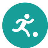
Spel en beweging/ bewegingsonderwijs